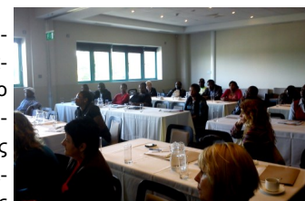
Στην παραπάνω φωτογραφία βλέπετε ένα πολυπληθές συμπόσιο στο Limerick της Ιρλανδίας στις 3 Οκτωβρίου 2012

διαφορών σχετικά με τη διαδικασία ένταξης των μεταναστών. Δεύτερον, το συμπόσιο δημιουργήθηκε για να επεξεργήσει το έργο SONETOR σε νέες κοινότητες και σε εδραιωμένους και μη εδραιωμένους φορείς που έχουν σκοπό να συμμετάσχουν στο έργο καθώς αυτό θα εξελίσσεται. Η μεγάλη συμμετοχή νέων κοινοτήτων καθώς και οι παρουσιάσεις των προσκεκλημένων ομιλητών οδήγησαν σε ένα εποικοδομητικό διάλογο. Αναμένεται ότι αυτή η ανταλλαγή ιδεών θα εμπλουτίσει το έργο και τα αποτελέσματά του. Ανάμεσα στους συμμετέχοντες υπήρχαν αρκετοί διακεκριμένοι καθηγητές πανεπιστημίων και ειδικοί στον τομέα της κοινωνικής δικαιοσύνης, της πολιτιστικής πολυμορφίας, της εκπαίδευσης, του νόμου, της ηγεσίας