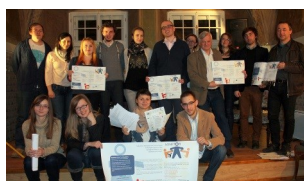
Το έργο και η πλατφόρμα του SONETOR καλωσόρισε τους Πολωνούς Διαπολιτισμικούς Μεσολαβητές

της Ισπανίας διοργάνωσε συνάντηση με 12 επαγγελματίες Μεσολαβητές στην πόλη Navarra. Οι θετικές παράμετροι καθώς και οι ανησυχίες σχετικά με το δίκτυο αλληλεπίδρασης συζητήθηκαν έντονα. Εκτίμησαν το ελκυστικό μέσο για ανταλλαγή απόψεων και εμπειριών σχετικά με την ένταξη και τα συναφή θέματα μεταξύ των χωρών. Οι δυνητικοί χρήστες