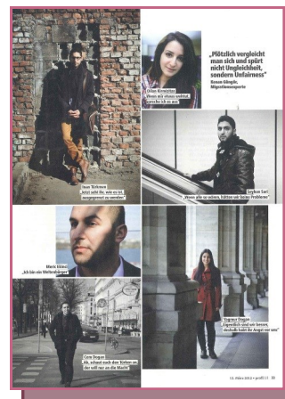
"Sorted out" (μεταφρασμένο από τη γερμανική λέξη "Ausortiert") είναι ο τίτλος του άρθρου στο περιοδικό "Profil" το οποίο αναφέρεται παραπάνω.

Το επιθυμητό και προβλεπόμενο κέρδος από την ανταλλαγή σχολίων και την προσθήκη καταχωρήσεων όπως αυτή μέσω της πλατφόρμας του SONETOR είναι η υποστήριξη των χρηστών στην αύξηση της ποιότητας των υπηρεσιών τους, η επίτευξη περισσότερων γνώσεων σχετικά με την κατάσταση ή η αύξηση της κατανόησης και της συμπάθειας για όλα τα εμπλεκόμενα μέρη. Οι