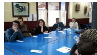
Ενδιαφέρουσες συζητήσεις έλαβαν χώρα στο πρώτο workshop του SONETOR στην Ισπανία.

Οι Ισπανοί συμμετέχοντες στο workshop απόλαυσαν τις συζητήσεις εκείνης την συνάντησης και συμφώνησαν να συμβάλουν στην πλατφόρμα με περιεχόμενο και παρατηρήσεις.