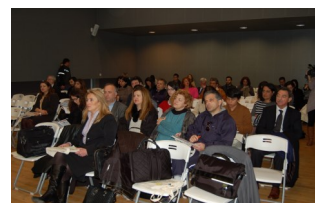
Φωτογραφία από το συνέδριο του SONETOR στην Πάτρα στις 8-9 Ιανουαρίου 2014. Για περισσότερες πληροφορίες, διαβάστε παρακάτω.

πει να τονιστεί ότι η πλατφόρμα θα είναι διαθέσιμη για όλους τους ενδιαφερόμενους φορείς ακόμα και μετά το τέλος του έργου, διασφαλίζοντας τη συνεχή ανταλλαγή ιδεών και τεχνογνωσίας ανά-